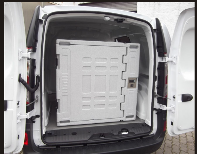
Kühlbox TK / FD